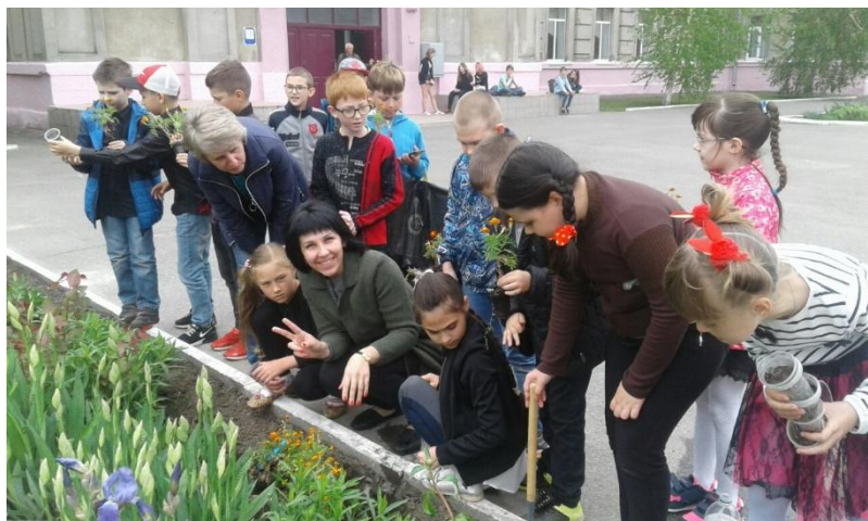
Фото № 4

Усі разом ми врятуємо світ від екологічної катастрофи